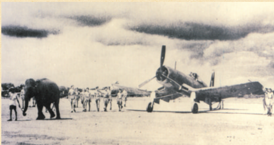
Průkopník aviatiky, přestože nesnášel výšky, si nedokázal odřici svůj nejmilejší dopravní prostředek - letadlo. A rozhodl se s ním i nadále cestovat.

Život v C & K nemocnici té doby nebyl lehký. Neochotný, špatně pla-